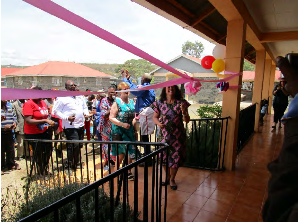
Offizielle Eröffnung des Kindergarten Gebäudes