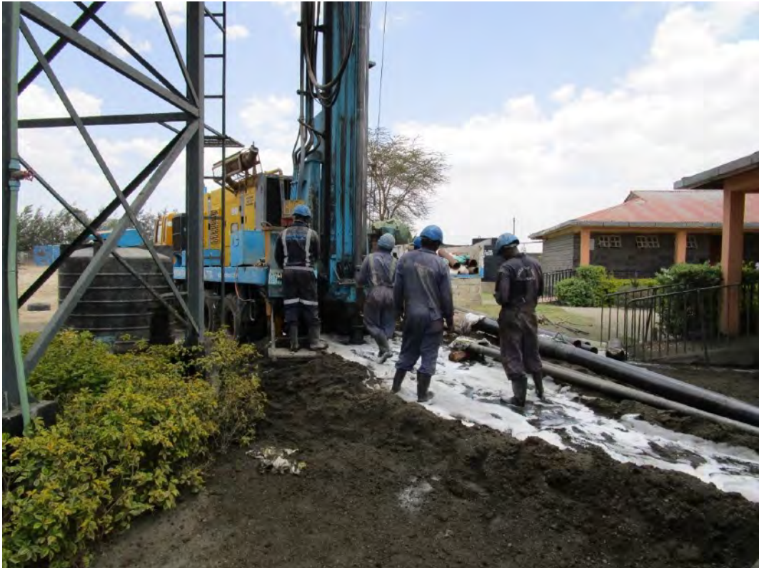
Beginn der Brunnenbohrung