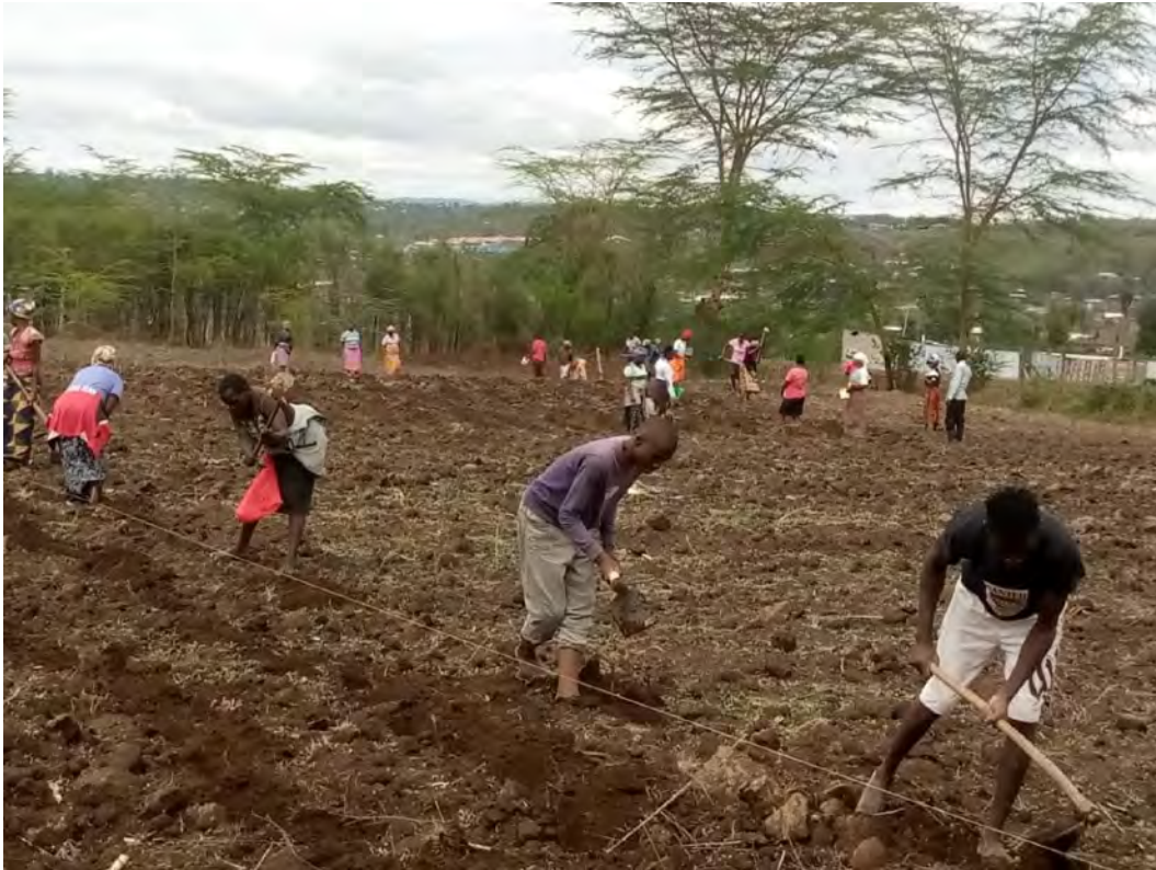
Eltern pflanzen Mais und Bohnen.