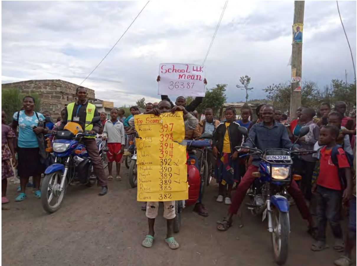
Kinder und Eltern feiern Prüfungsergebnisse auf der Straße