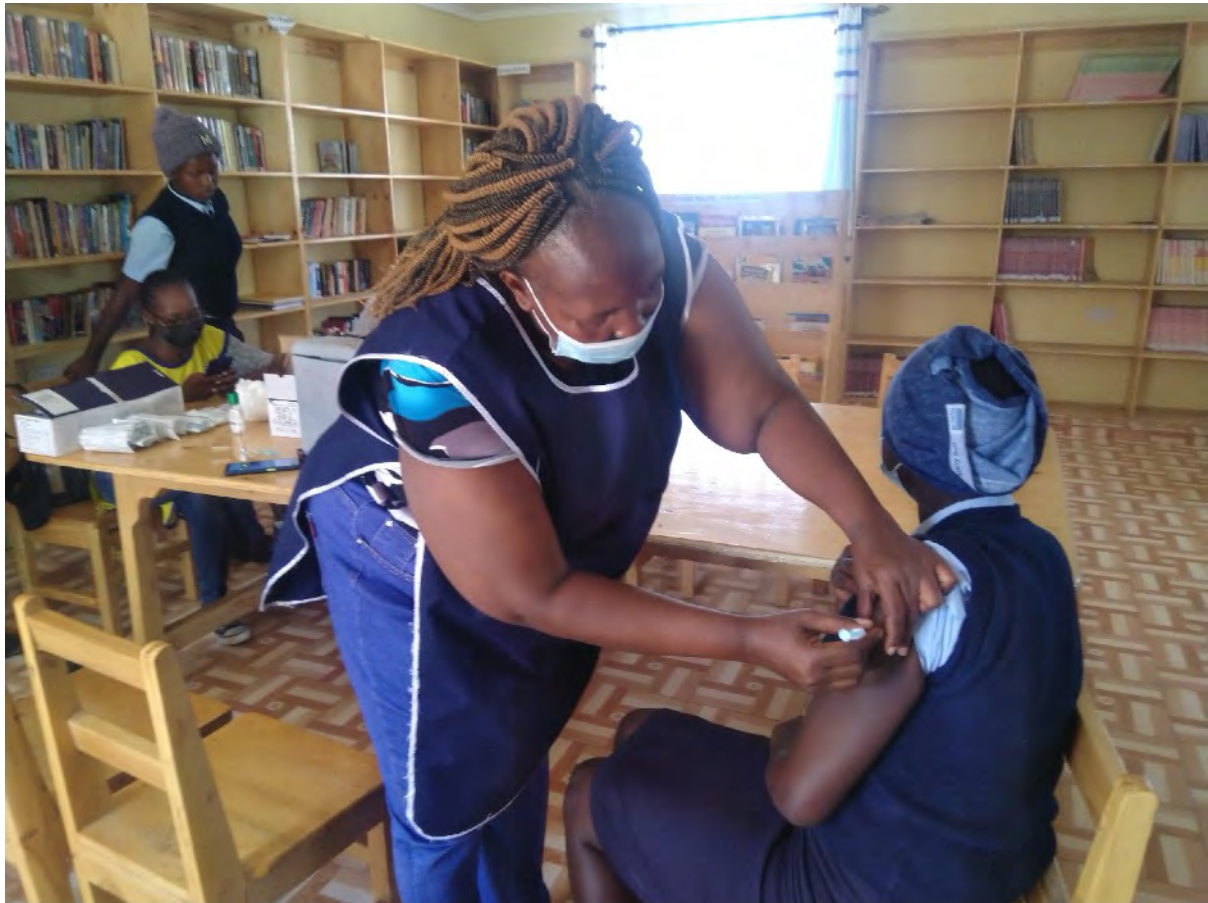
Ein Mediziner impft eines unserer Kinder gegen Covid-19

Wir haben letztes Jahr (2021) Beamte des Gesundheitsministeriums hinzugezogen, um Mitarbeiter und Eltern zu impfen. Dieses Jahr haben wir sie geholt, um Kinder zwischen 15 und 17 Jahren zu impfen.