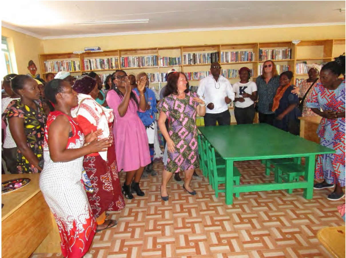
Offizielle Eröffnung unserer modernen Bibliothek