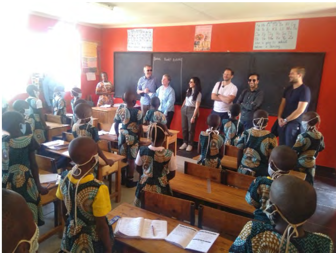
Familie Podschlapp und Freunde besuchen eines unserer Klassenzimmer