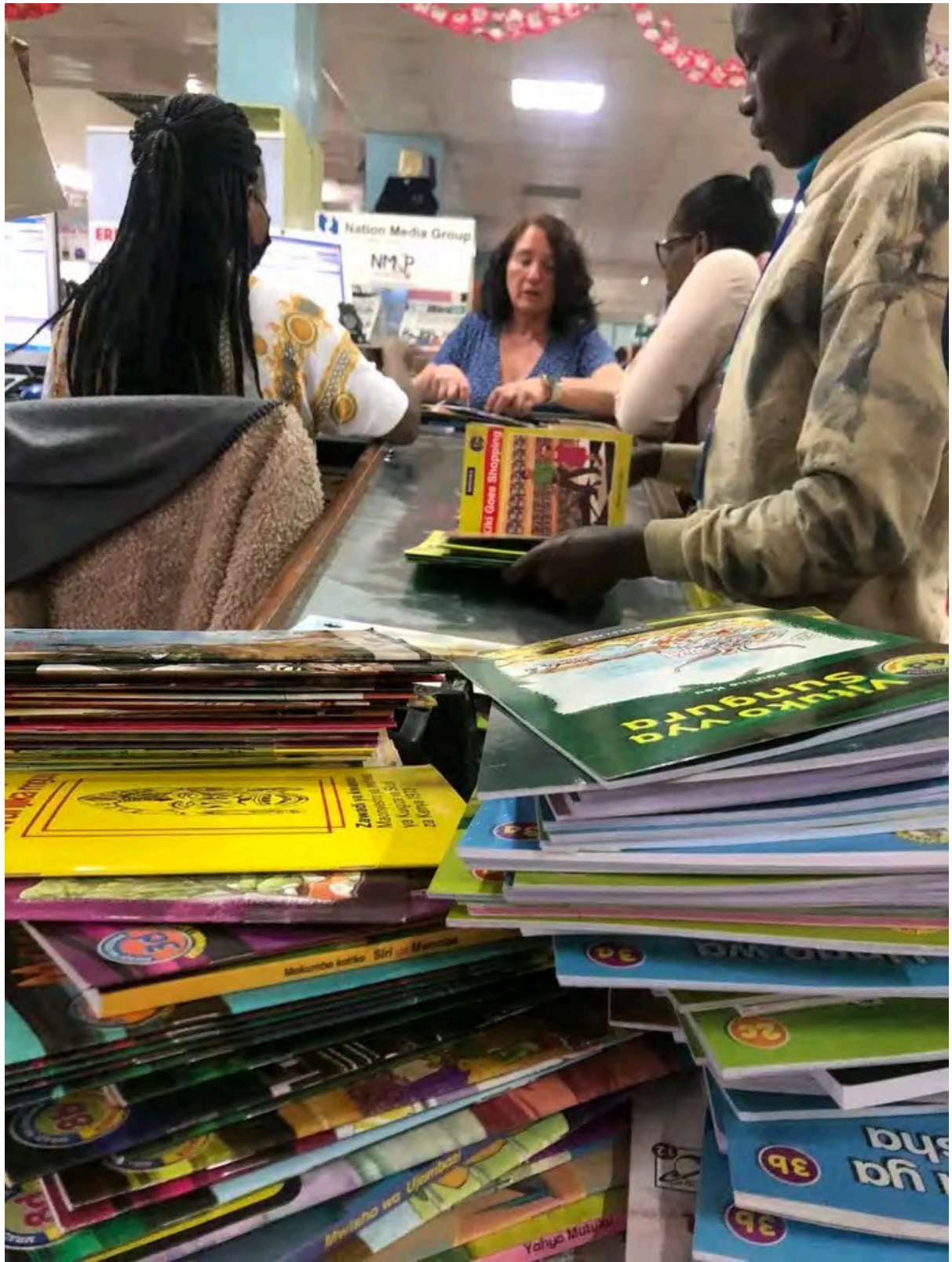
Brique in der Buchhandlung