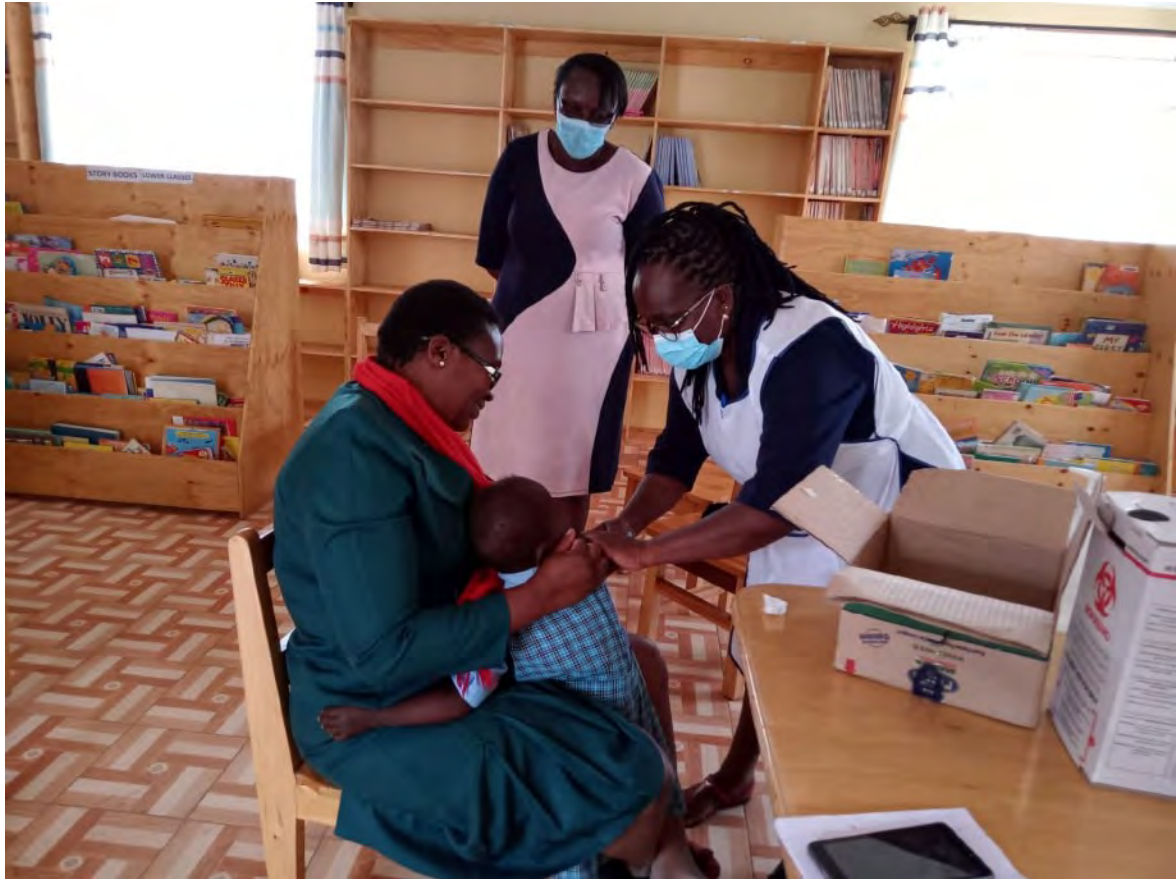
Impfung gegen Masern für Kinder unter 5 Jahren