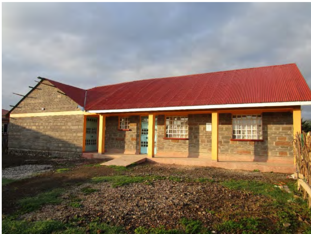
Links die neue Computerabteilung und rechts unsere Schneiderei