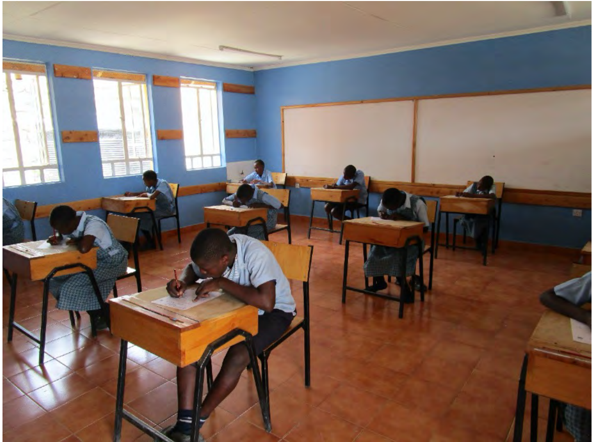
Unsere Kinder der 8. Klasse im Prüfungsraum