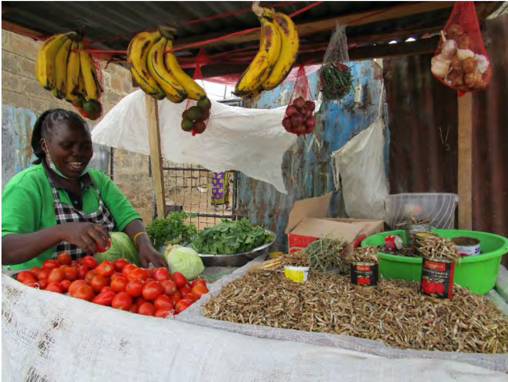
Eine Mutter verkauft an ihrem Stand Tomaten, eine andere verkauft Gemüse und Fisch.