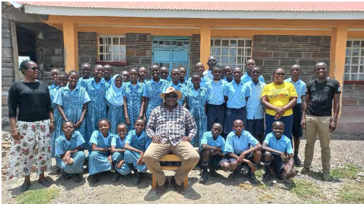
Die 8. Klasse direkt nach den Prüfungen