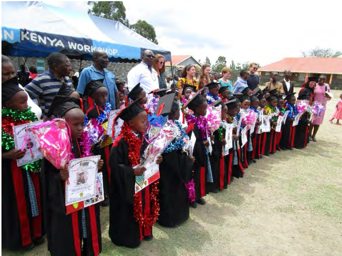
Vorschulkinder während ihres Abschlusstages