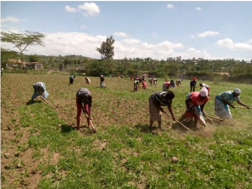
Eltern jäten die Mais- und Bohnenfelder