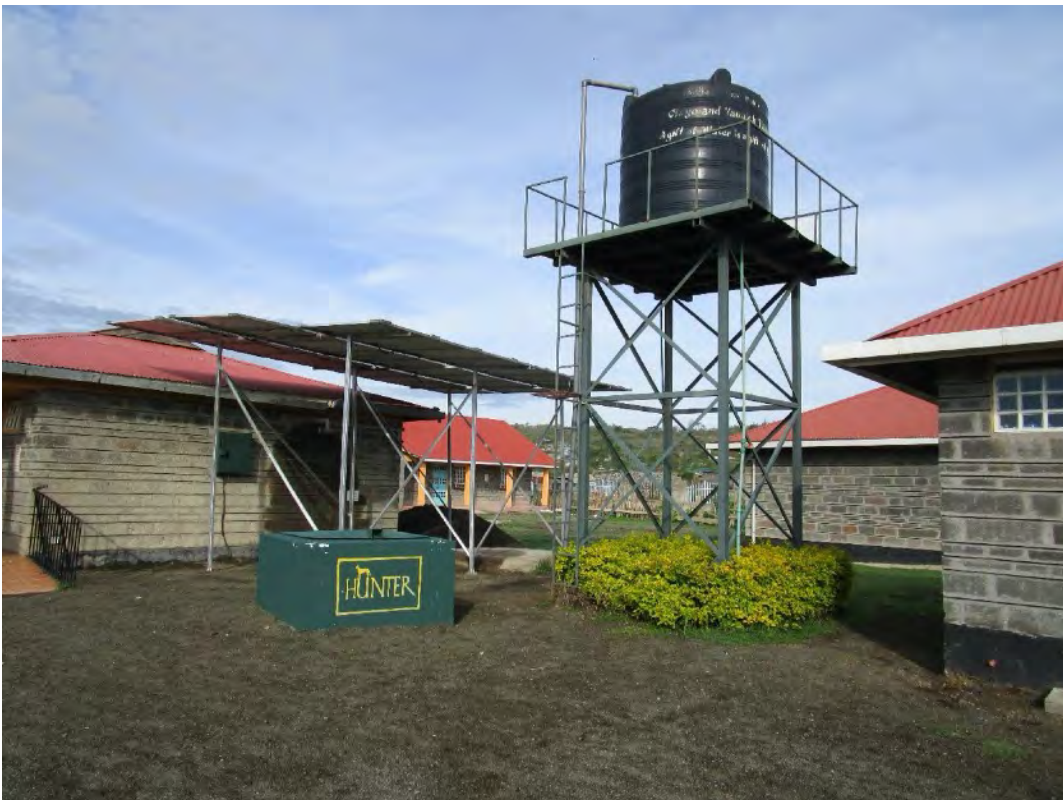
Ein kompletter Brunnen, der mit Sonnenkollektoren ausgestattet ist